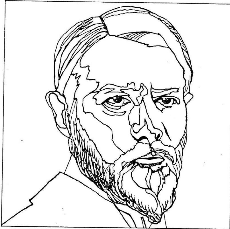
MAX WEBER (1864—1920)

planläggning i sig själv kan generera sociala konflikter. Inte heller i den marxistiskt inspirerade planläggningsdiskussionen (som ju annars borde ta fasta på dialektikens omsjungna förmåga att se motsättningarna i tingen) uppfattas själva planläggningsprocessen som något socialt motsättningsförhållande.