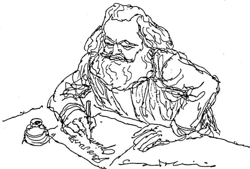
KARL MARX (1818—1883) Teckning av Ebbe Sadolin.

De intellektuella uppfattas mer på linje med partier, regeringar och byråkratier: de formulerar och utför de i det ekonomiska livet och produktionen utvecklade sociala huvudklassernas intressen och viljor. Men själva har de inga samhälleliga ambitioner.